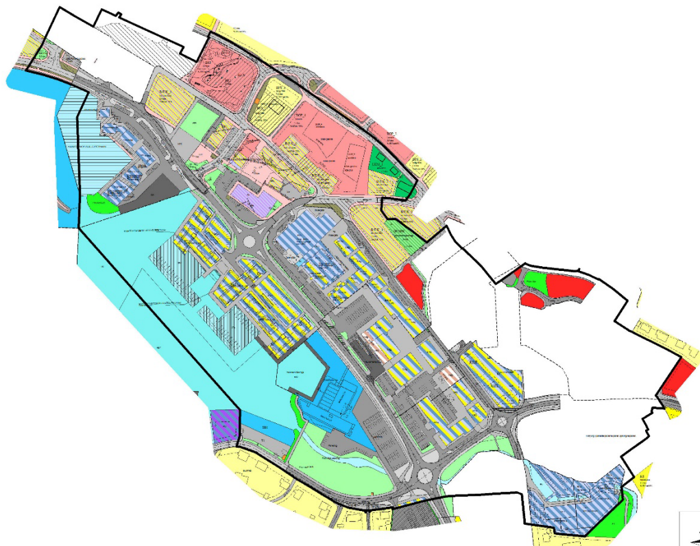
Kartet som syner plangrensa over gjeldande reguleringsplansituasjon. I kvite felt gjelder eldre reguleringsplanar.