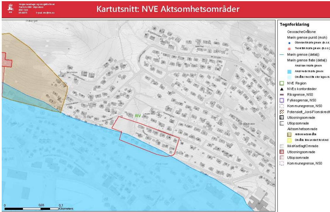
Aktsemdsområder og marin grense i høve til planområdet

Som det går fram av kartet ovanfor, ligg det aktuelle planområdet med god avstand til aktsemdsområdet syd for Osberget.