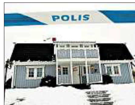
Den svenske filmanmelderen Jan-Olav Andersson mener produksjonen Vägen hem om Knutby-drapet er et «sammensurium av dokumentarbilder og tafatte rekonstruksjoner med skuespillere».